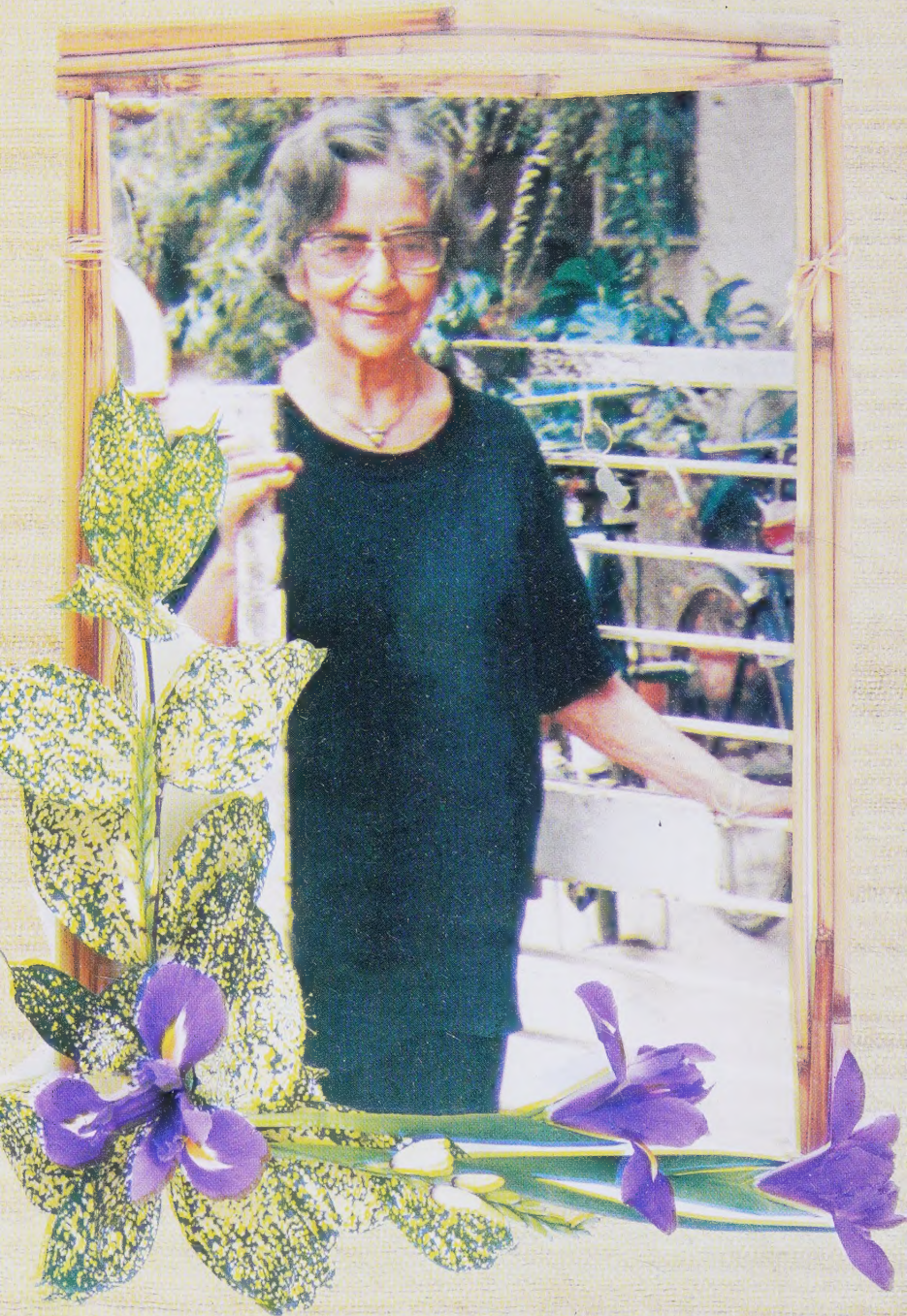
AMRITA PRITAM at her home in New Delhi